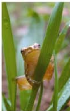
Rainette crucifère se promenant d'herbe en fleur

La photographie qui a reçu la note la plus élevée s'est ainsi mérité la première position. Cette image a à cet effet été retenue pour l'emblème du bulletin d'information, laquelle se trouve d'ailleurs sur la première page. Il s'agit de M. Mathieu Wéra-Bussière pour le Ruisseau du Site patrimonial de Saint-Jacques-de-Leeds. La photographie représente une rainette crucifère se promenant d'herbe en fleur. Monsieur Wéra-Bussière s'est donc vu recevoir une magnifique lithographie d'une valeur de 300 $, gracieuseté de Canards Illimités Canada.