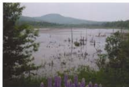
Aux alentours de l'étang