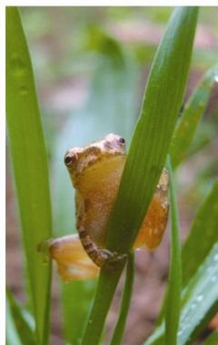
Rainette crucifère se promenant d'herbe en fleur

La photographie qui a reçu la note la plus élevée s'est ainsi mérité la première position. Cette image a à cet effet été retenue pour l'emblème du bulletin d'information, laquelle se trouve d'ailleurs sur la première page. Il s'agit de M. Mathieu Wéra-Bussière pour le Ruisseau du Site patrimonial de Saint-Jacques-de-Leeds. La photographie représente une rainette crucifère se promenant d'herbe en fleur. Monsieur Wéra-Bussière s'est donc vu recevoir une magnifique lithographie d'une valeur de 300 $, gracieuseté de Canards Illimités Canada.