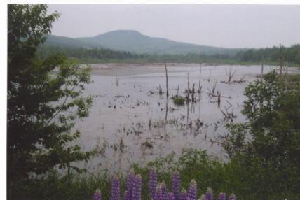
Aux alentours de l'étang